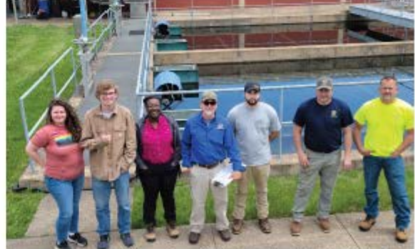
El equipo de la Planta de Potabilización